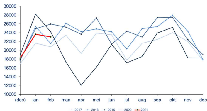
Aantal ontvangen vacatures per maand

Voor elke maand van de voorbije vijf jaren wordt het aantal in die maand ontvangen vacatures getoond. De maand-op-maand evolutie en de seizoensschommelingen zijn duidelijk. Ook is zichtbaar hoe een bepaalde maand scoort in vergelijking met dezelfde maand in andere jaren.