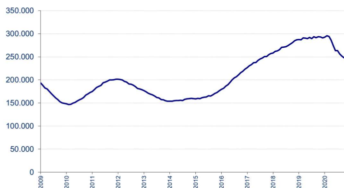
Aantal ontvangen vacatures in de laatste 12 maanden

Voor elke maand wordt het aantal in de voorbije twaalf maanden ontvangen vacatures getoond. De seizoensinvloeden zijn in deze grafiek niet zichtbaar en de trend is duidelijker.