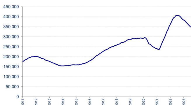
Aantal ontvangen vacatures in de laatste 12 maanden

Voor elke maand wordt het aantal in de voorbije twaalf maanden ontvangen vacatures getoond. De seizoensinvloeden zijn in deze grafiek niet zichtbaar en de trend is duidelijker.