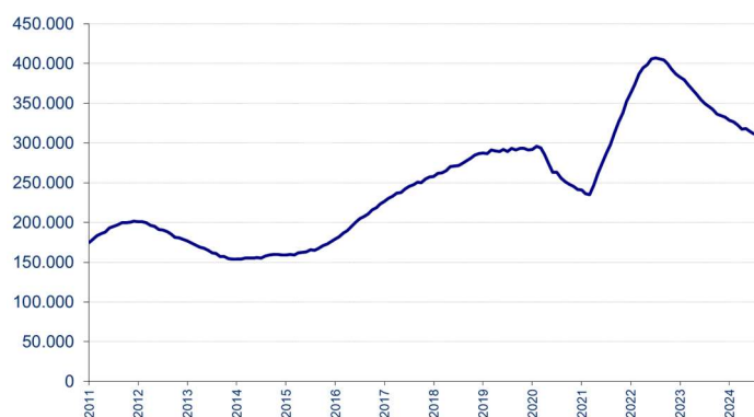
Aantal ontvangen vacatures in de laatste 12 maanden

Voor elke maand wordt het aantal in de voorbije twaalf maanden ontvangen vacatures getoond. De seizoensinvloeden zijn in deze grafiek niet zichtbaar en de trend is duidelijker.