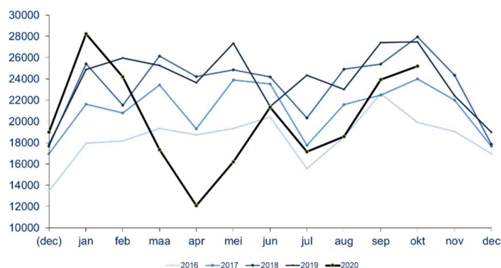
Aantal ontvangen vacatures per maand

Voor elke maand van de voorbije vijf jaren wordt het aantal in die maand ontvangen vacatures getoond. De maand-op-maand evolutie en de seizoensschommelingen zijn duidelijk. Ook is zichtbaar hoe een bepaalde maand scoort in vergelijking met dezelfde maand in andere jaren.