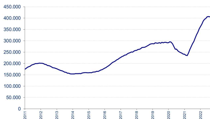
Aantal ontvangen vacatures in de laatste 12 maanden

Voor elke maand wordt het aantal in de voorbije twaalf maanden ontvangen vacatures getoond. De seizoensinvloeden zijn in deze grafiek niet zichtbaar en de trend is duidelijker.