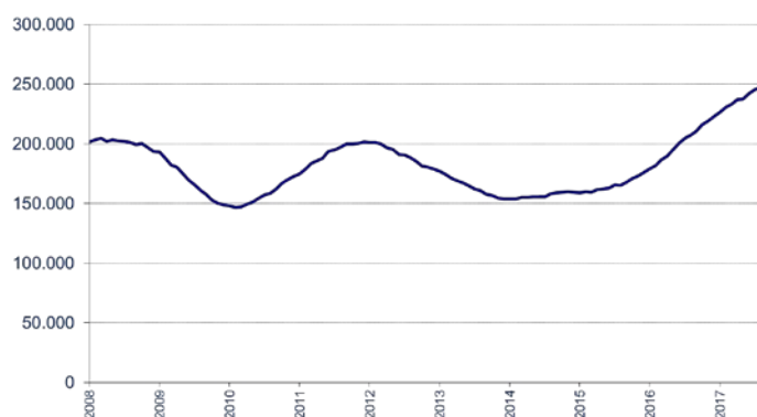
Aantal ontvangen vacatures in de laatste 12 maanden

Voor elke maand wordt het aantal in de voorbije twaalf maanden ontvangen vacatures getoond. De seizoensinvloeden zijn in deze grafiek niet zichtbaar en de trend is duidelijker.