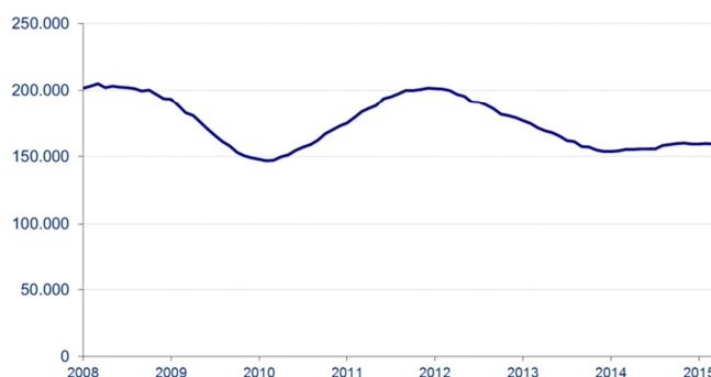
Aantal ontvangen vacatures in de laatste 12 maanden

De bovenstaande grafiek toont voor elke maand het aantal tijdens de voorbije twaalf maanden ontvangen vacatures. De seizoensinvloeden worden daardoor uitgeschakeld en de trend wordt duidelijker.