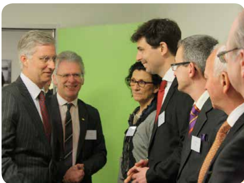
Z.K.H. Prins Filip ontmoet de leidende verantwoordelijken van de Belgische openbare diensten voor arbeidsbemiddeling en beroepsopleiding

Filip I, Koning der Belgen sinds 21 juli 2013 heeft altijd veel interesse getoond voor de problematiek van de jeugdwerkloosheid en voor de voorgestelde oplossingen. Op 28 februari 2013 heeft Z.K.H. Prins Filip de verantwoordelijken van Synerjob ontmoet in het Brusselse Beroepenreferentiecentrum voor de bouw in Anderlecht. Hij had er een gesprek met de leidende ambtenaren van de Belgische openbare diensten voor arbeidsbemiddeling en opleiding over jeugdwerkloosheid en ontmoette er ook stagiairs en werkzoekenden uit de verschillende gewesten van het land.