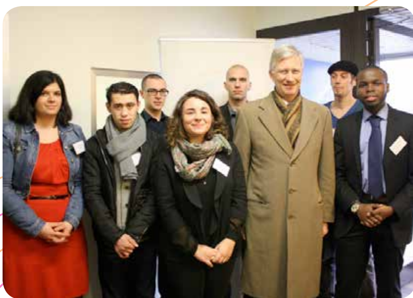
Z.K.H. Prins Filip en de jonge werkzoekenden uit verschillende gewesten van het land die een gesprek met hem hadden