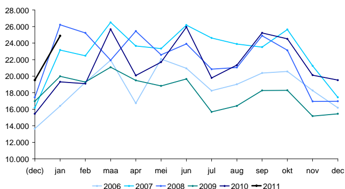
Aantal ontvangen vacatures per maand

De bovenstaande grafiek toont voor elke maand van de voorbije zes jaren het aantal in die maand ontvangen vacatures. De grafiek toont duidelijk de maand-op-maand evolutie en de seizoensschommelingen. Ook is zichtbaar hoe een bepaalde maand scoort ten opzichte van dezelfde maand in andere jaren.