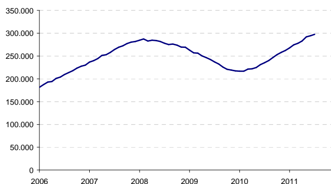
Aantal ontvangen vacatures in de laatste 12 maanden

De bovenstaande grafiek toont voor elke maand het aantal tijdens de voorbije twaalf maanden ontvangen vacatures. De seizoensinvloeden worden daardoor uitgeschakeld en de trend wordt duidelijker.